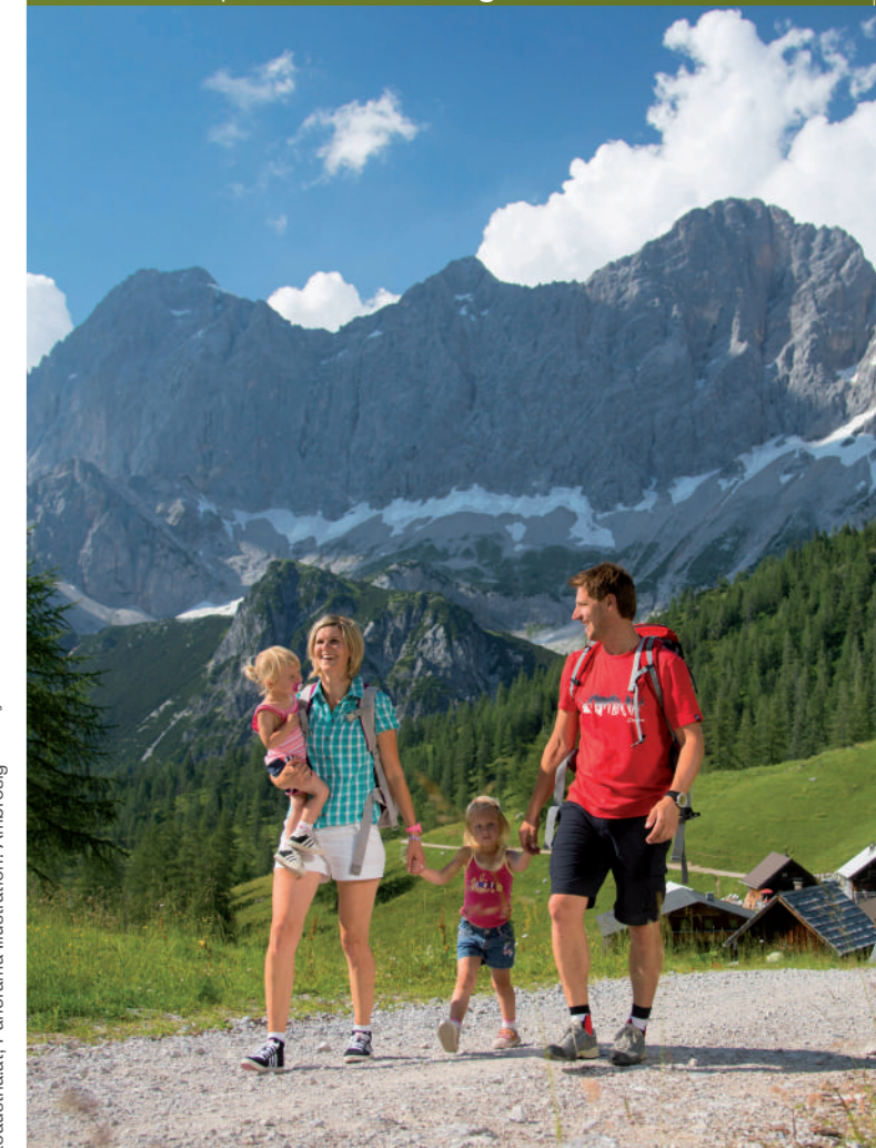
Panorama Illustration: Ambrosig